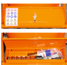
Cutie atasata pe sasiu cu accesorii si produse de intretinere