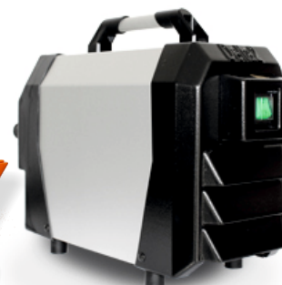
NOU! Compresor DELTA Germania

In lipsa retelei de alimentare, este necesar sa utilizati un generator de curent electric de min. 15 kVA.